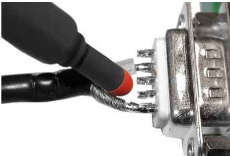
Anwendung BS 04DB